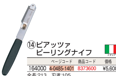
⑭ ピアツァ ピーリングナイフ