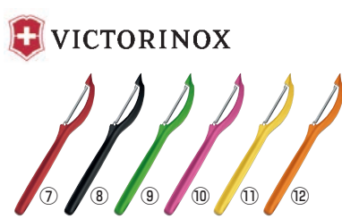
VICTORINOX ビクトリノックス ユニバーサルピーラー