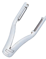
⑥ ウェストマーク ダブルピーラー