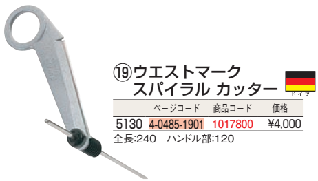
⑲ ウェストマーク スパイラル カッター