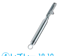
④ レズレー 18-10 スイープルピーラー 右利き用