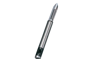
② ツヴィリング ピーラー