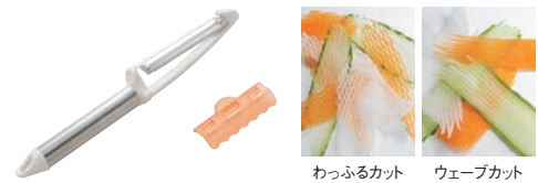
⑯ わっふるサラダピーラー