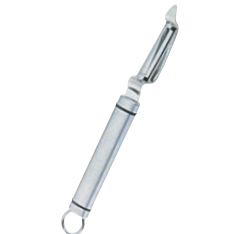
① 18-8 I型ピーラー (9981-249)

Check! I型ピーラー……じゃがいもやリンゴなど、小さくて丸みのあるものにおすすめ! 庖丁の感覚で切れます。