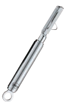
⑤ レズレー 18-10 スイープルピーラー 左利き用