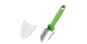
⑰ フルベジ キャベツの芯取り

材質:本体/ABS樹脂 ハンドル、刃フレーム/ステンレス鋼 切れ刃/ステンレス刃物鋼 安全ホルダー/メタクリル樹脂 ●独自開発のギザ刃で大根やニンジン、キュウリなどを細かい網目状にカットできる新発想の字型ピーラーです。 ●Xの文字を描くように角度を変えながら野菜をスライスするだけで網目模様が作れます。また、普通にスライスするとウェーブ状にカットできます。