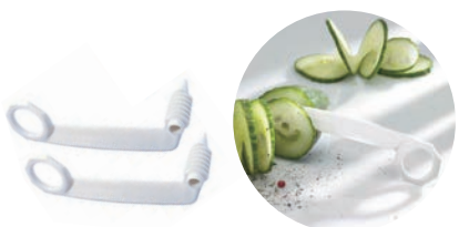
⑱ ベルナー スパイラルカッター くるくる 2個セット