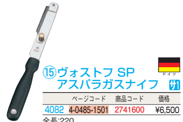
⑮ ヴォストフ SP アスパラガスナイフ