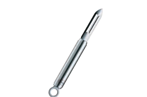
③ レズレー 18-10 タテ型ピーラー